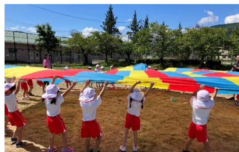
みんなの息を合わせて、えい!! (年中さん)