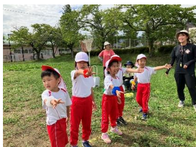
年長さんのリレーもお楽しみに!!