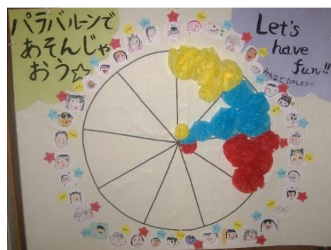
年中さんパラバルーンがんばり表 (9月3日撮影)

ヒカリンピックまであと10日ほどとなりました。各学年では、できたことが増えるたびに、がんばり表(上の写真)に、お花を貼り、全面をお花で埋めることを目標に練習をしています。「今日は、早く並べた!」「もっとじょうずになるにはどうすればいいかな?」「ここを合わせて頑張る!!」などと、話し合いながらお花を貼っています。運動会までに、たくさんのお花が貼られそうですね。職員も、子どもたちの力と考えを信じて、子どもたちとともに運動会に向かっていきます。各学年からの運動会のおたよりをご覧ください、 当日も一人ひとりのひかりっこストーリー をお楽しみに!