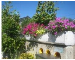
園門のペチュニア