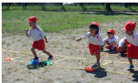
最後まで走り切ります!(年少さん)

ヒカリンピックまであと10日ほどとなりました。各学年では、できたことが増えるたびに、がんばり表(上の写真)に、お花を貼り、全面をお花で埋めることを目標に練習をしています。「今日は、早く並べた!」「もっとじょうずになるにはどうすればいいかな?」「ここを合わせて頑張る!!」などと、話し合いながらお花を貼っています。運動会までに、たくさんのお花が貼られそうですね。職員も、子どもたちの力と考えを信じて、子どもたちとともに運動会に向かっていきます。各学年からの運動会のおたよりをご覧ください、 当日も一人ひとりのひかりっこストーリー をお楽しみに!