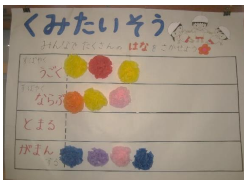
年長さん組体操がんばり表(9月3日撮影)