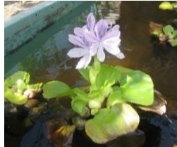
ピオトープのホテイソウ

園門横で、青空と園舎をバックに咲く“三時草”。毎日午後3時頃になると咲く花が、かわいいですね。(園児のおばあちゃんからいただきました。)