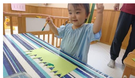
衣装の準備 おえかき中♡ (ひよこさん)