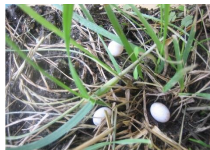
にじ組で飼っている かなへびも卵を産んで、 赤ちゃんが生まれました！ (赤ちゃんは、すでに野原に帰りました。)