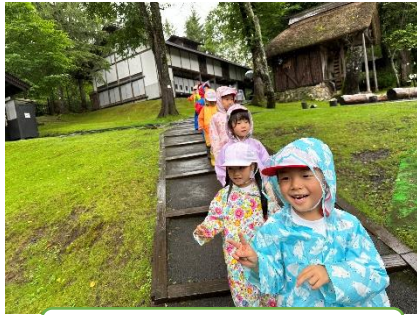
雨の忍者村もいいね！