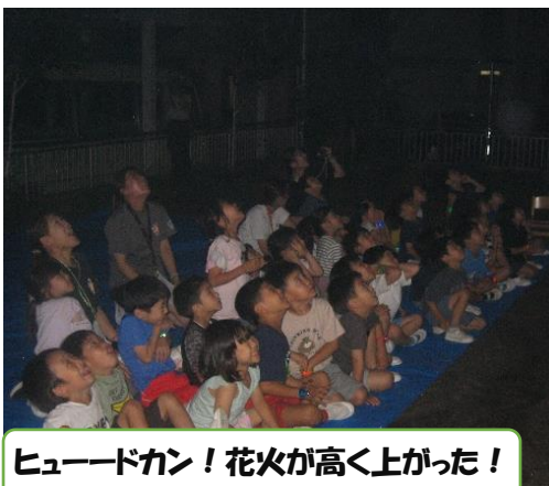
ヒュードカン！花火が高く上がった！

ひかり園での楽しい思い出が、たくさんできたと同時に、初めての体験の数々をやり切った「自信」を、年長の子どもたちは持つことができましたと感じます。保護者の皆様には、長きにわたり、ご協力いただきました。ありがとうございました。