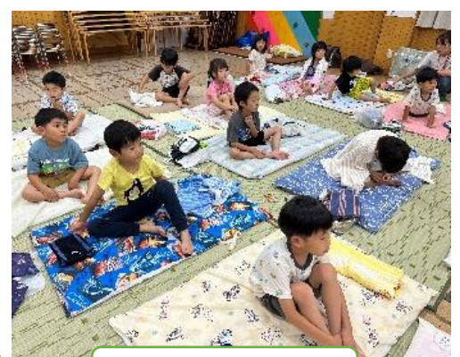
いよいよお泊りなのだ！