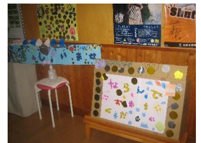
夏祭りの飾りつけもばっちり！！

雨降りの中でのスタートでしたが、雨ニモマケズ、風ニモマケズ、元気に過ごしてきました。忍者村では合羽を着たり、脱いだりすることが何回かありましたが、みんなスムーズにできました！からくり屋敷では、挑戦の連続。キャー、ワー、時には涙…とありましたが、笑顔で出口に出てきました！！夏祭りは、自分たちでやりたいことを出し合って計画、準備して大いに楽しみました。射的で当たらない友達に、「がんばれ、がんばれ」と自然に声をかける姿も見られました。いつもとは違う暗い園庭で、打ち上げ花火にも「頑張れ！！頑張れ！！」と力いっぱい(声をからして?)応援したので、花火も高く打ちあがりました！！そして、初めてお家の人と離れて、園の体育館でお友だちと隣り合って寝た夜・・・寂しくなることもあったけど、がんばりました！！朝は、5時過ぎから起きていた子がいましたが、ほかの寝ている人の邪魔をしないように、静かに過ごすことができました。立派ですね♡。また、夕飯の時、隣になった友だちに、「よろしくな。今夜もな。」と声がけしている子どもの姿に、普段はかわいらしい子どもたちの中に確実に育っている「社会性」や友達との「絆」を感じました。