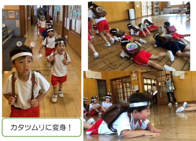
カタツムリに変身！