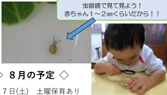
虫眼鏡で見て見よう！ 赤ちゃん1～2mmくらいだから！！