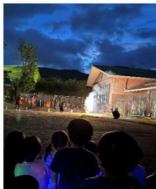
「花火頑張れ！頑張れ！」