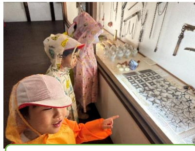
忍者の手裏剣、すごい！！