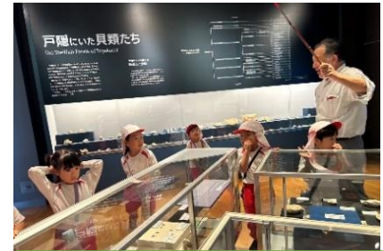
戸隠は昔、海の底にあったんだって！ (戸隠地質化石博物館)

雨降りの中でのスタートでしたが、雨ニモマケズ、風ニモマケズ、元気に過ごしてきました。忍者村では合羽を着たり、脱いだりすることが何回かありましたが、みんなスムーズにできました！からくり屋敷では、挑戦の連続。キャー、ワー、時には涙…とありましたが、笑顔で出口に出てきました！！夏祭りは、自分たちでやりたいことを出し合って計画、準備して大いに楽しみました。射的で当たらない友達に、「がんばれ、がんばれ」と自然に声をかける姿も見られました。いつもとは違う暗い園庭で、打ち上げ花火にも「頑張れ！！頑張れ！！」と力いっぱい(声をからして?)応援したので、花火も高く打ちあがりました！！そして、初めてお家の人と離れて、園の体育館でお友だちと隣り合って寝た夜・・・寂しくなることもあったけど、がんばりました！！朝は、5時過ぎから起きていた子がいましたが、ほかの寝ている人の邪魔をしないように、静かに過ごすことができました。立派ですね♡。また、夕飯の時、隣になった友だちに、「よろしくな。今夜もな。」と声がけしている子どもの姿に、普段はかわいらしい子どもたちの中に確実に育っている「社会性」や友達との「絆」を感じました。