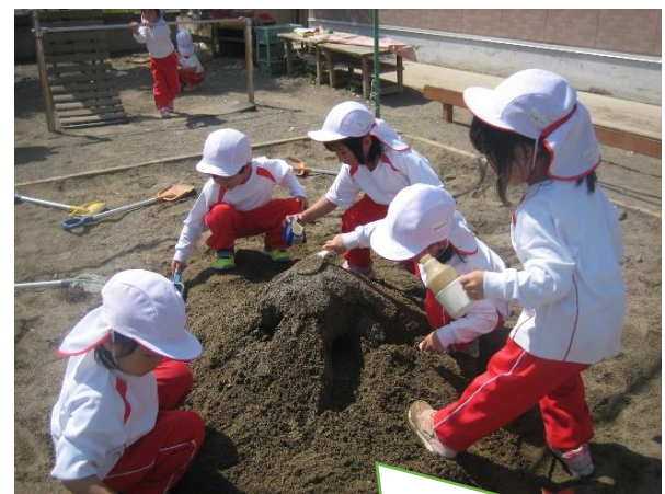
大きなお山とトンネルができた！水をたくさん運んできて川も作ったよ！！