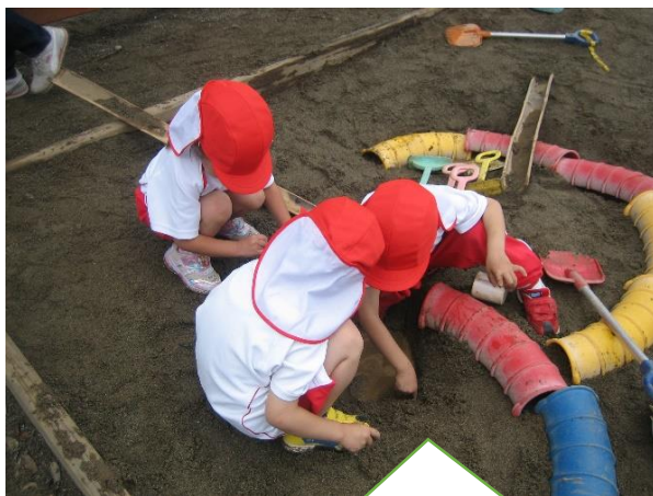
「穴に、もっと水をためたい！」とせっせと水を運んでくる子どもたち。でも「すぐ水がなくなっちゃうよ！」