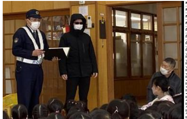
《不審者に声をかけられたら……》