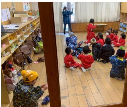
《不審者が来たからじっとしているよ》