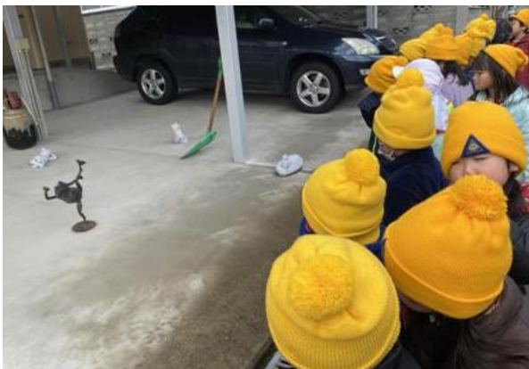
《ここにもカエルさんがいっぱい!》

◆これなんだろう? ○……? ◆つららっていうんだよ ○つら? ○つらら? ◆アハハ!—