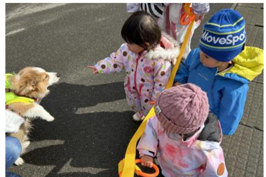
《犬さん、こんにちはー！》