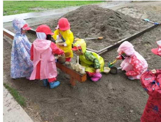
『タピオカできたよー！』