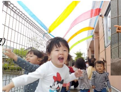
『あめがひかっているよー！』