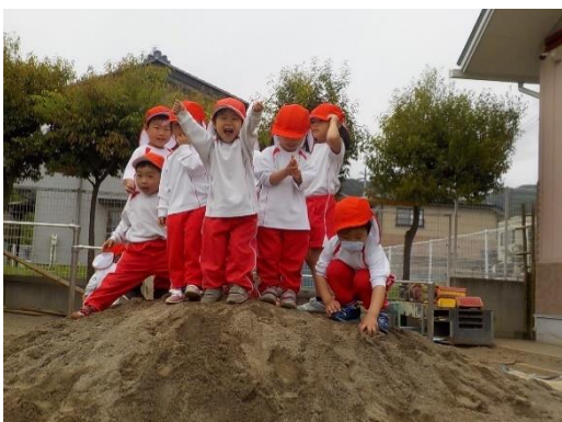
『やったー!お山のてっぺんだよー!』