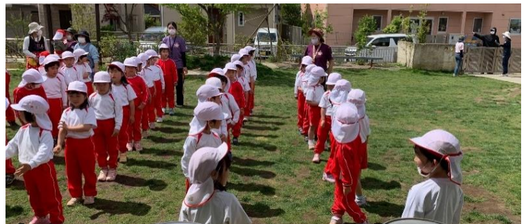
【門の近くに不審者出現！でもあわてません】