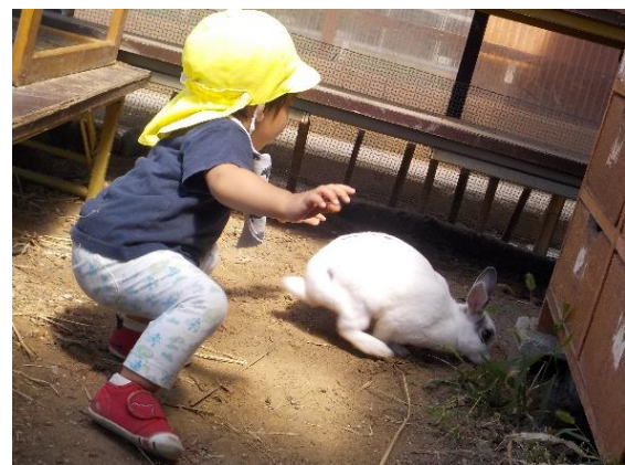
『ウサコーこっちへおいでよー!』