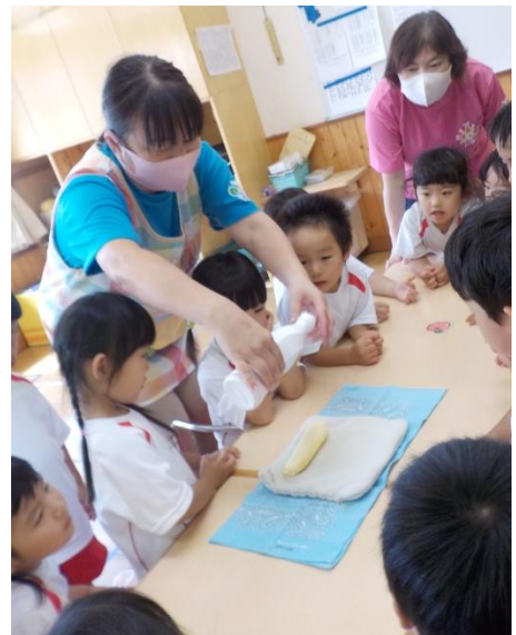
ワクワククッキング② 『パンの上にバナナをのせてー』