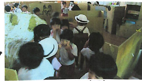
「おばけやしき 迷路」