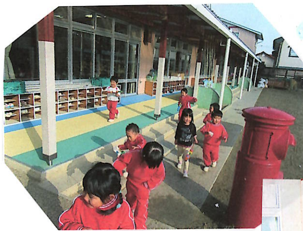
いっぱい降ってきた!! 教室から走り出す子どもたち♡