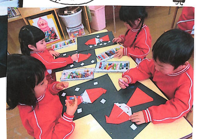
お友達の絵を見て「上手だね〜」という姿