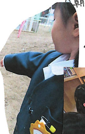
「こかんで みよう!! あわい... つめたい(涙)」