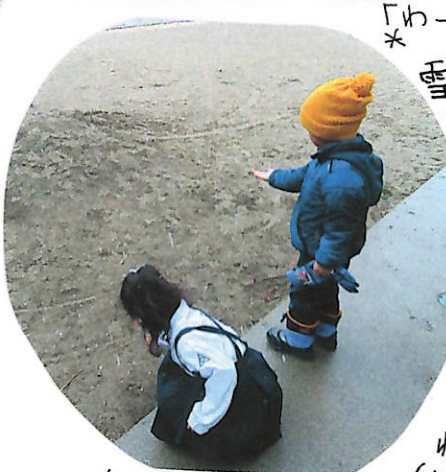
手に乗りないよ〜 と不思議そうなお二人...