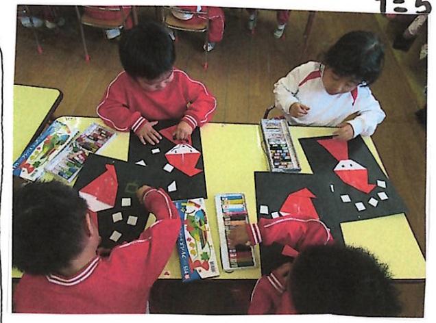
クレヨンを持つと真剣な子どもたち